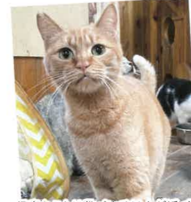
名前:はっすん 年齢:7歳 男の子

食べるのも遊ぶのも大好き!構ってもらえる時は甘えたさんになります。口元にある2つのほくろがチャームポイント。チュールもおもちゃも大好きです。