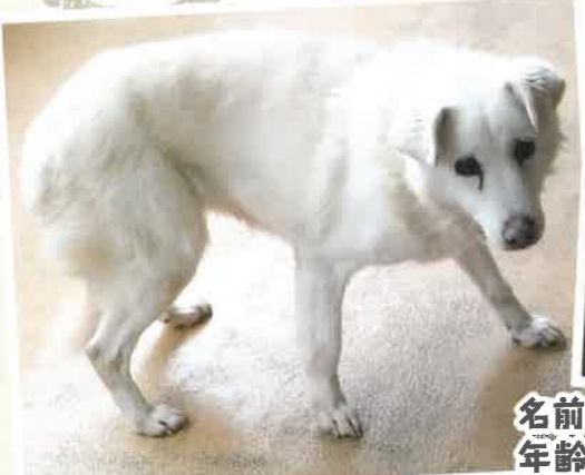
名前:じゅあ 年齢:13歳 女の子

怖がり&引きこもりなじゅあ。生活場所は小屋の中。ご飯を食べるのも小屋の中。ご飯の気配を察知すると小屋から顔だけを出して様子を伺う様子がとても可愛い女の子です。じゅあに寄り添って下さる飼い主さん、募集中!