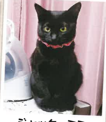
ジャック→ミミ 2023年 1/23 卒業

ご希望のご家族様には、動物をスムーズに迎えていただけるよう、面談を受けて頂いております。 悪しからずご了承くださいませ。まずは、お気軽に見学会にご参加下さい。 見学会のご予約は TEL 072-737-1707