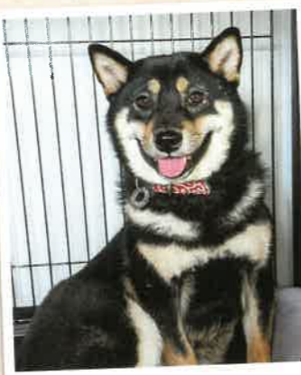
どれみ→くるみ 2023年 1/20 卒業