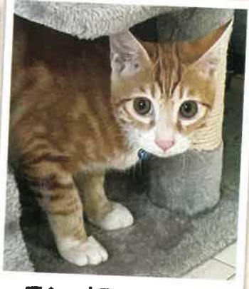
モンブラン→ラテ 2022年 11/24 卒業