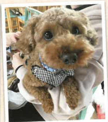
日向→くま 2022年 12/12 卒業