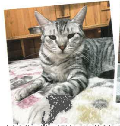
名前:トトロ 年齢:3歳 男の子

大きな体のトトロ!猫ちゃんと仲良しです。当初は警戒心が強くシャーシャー言っていたんですが今は落ち着いて過ごしています!なでなでできるようになりました!