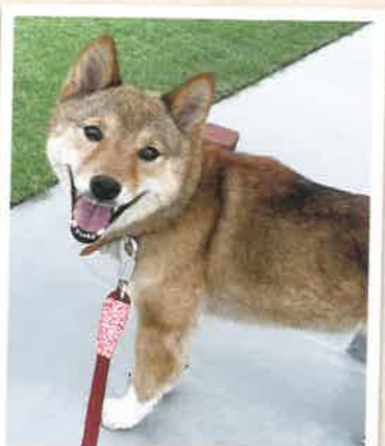
とみ→ひまわり 2022年 11/20 卒業