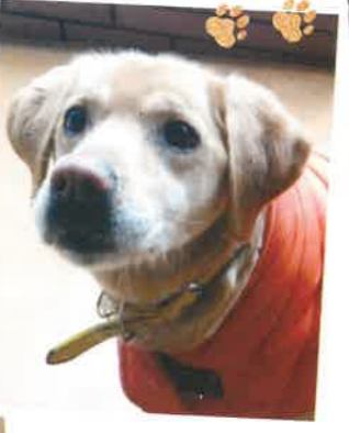
名前:ワッピー 年齢:13歳 女の子

グイグイ系甘えん坊女子。人が大好きで一日中、人の近くをうろうろして体を擦り付け猛烈にアピールします。撫でてもらうと満面の笑みでご満悦。可愛がってくれるご家族さん、お待ちしております。