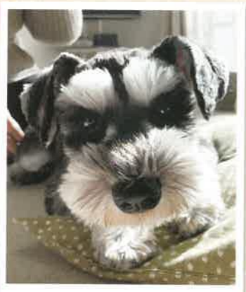
いくら→ABBY(アビー) 2023年 1/15 卒業