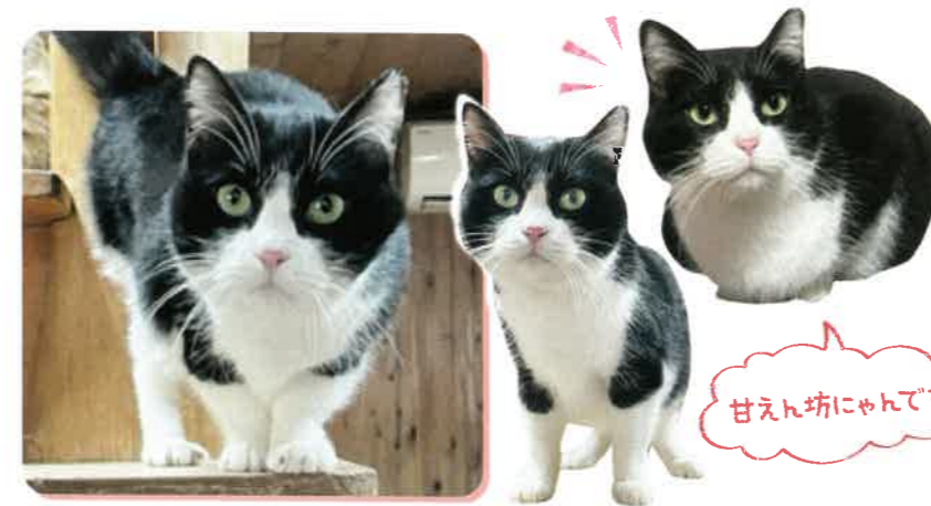
ナミ 推定7歳 女の子

寒い中お庭ですっと過ごしていたよるいちさん。いつの間にかホットカーペットの上でくつろげるようになっていました! ムツとしたような表情をしていますが実は撫でてもらうのが好きです。あごの下やお尻を撫でてあげると喉を鳴らしてくれます♪