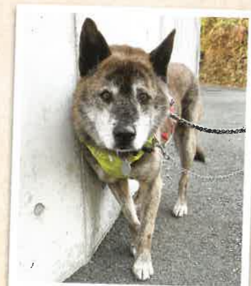
ライ 2022年 11/23 卒業