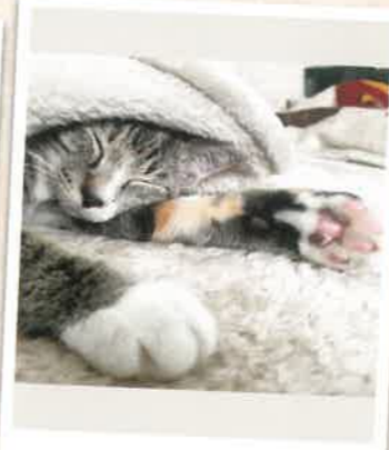
キャラメル→ana 2022年 11/14 卒業