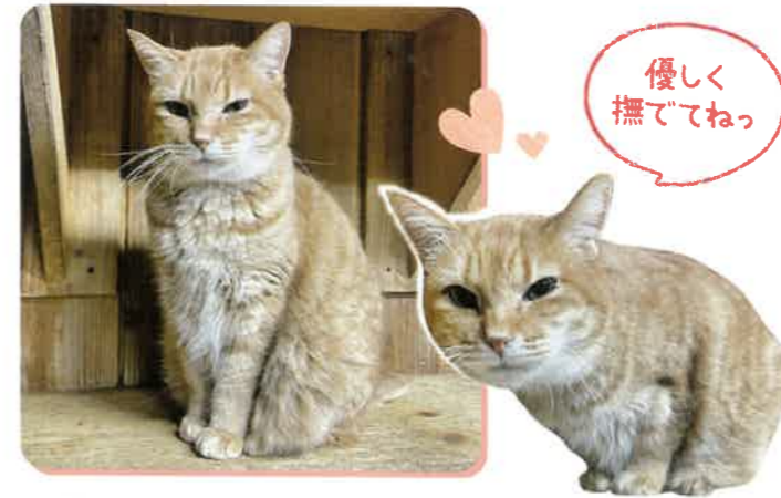
あかちゃん 推定7歳 女の子

棚の上やホットカーペットの上が定位置になりました。急に近くに行くと少し警戒しますが、においをかいでもらってからそっと撫でてあげると嬉しそうにしてくれます♡