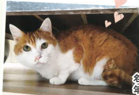
名前:チェリー 年齢:6歳 女の子

大きな体なのに甘えたさん。よく棚の上から呼んでくれます!ご飯をあげに行くと、鳴きながら後ろをついてきてアピールしてくれます!