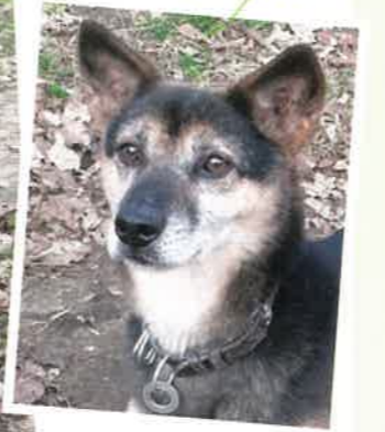
名前:ポチ 年齢:8歳 男の子

走るの、食べるの大好きな男の子。時々、後ろからソロリと近づいておやつを持っているか確認しに来る姿は獲物を狙うハンターみたくです。怖がりな一面もあるので、ゆっくりポチのペースに合わせて下さる家族さんを募集中。