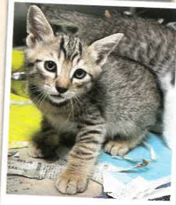
いっしん 2022年 11/21 卒業