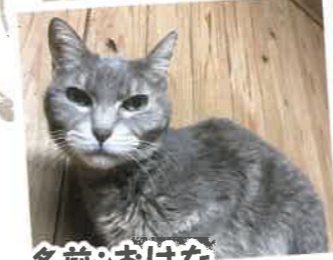
名前:おはな (エイズキャリア) 年齢:11歳 女の子

とっても美人なおはなちゃん。1人でのんびり過ごしたいタイプですが、目を見て名前を呼ぶと甘えてきてくれます!キャットタワーの中など、隠れることのできる場所で寝ていることが多いです!