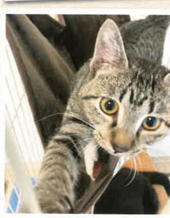
オレ 2022年 11/6 卒業