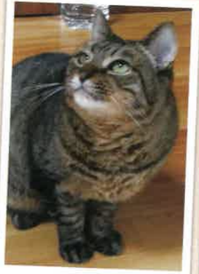
ころん 2023年 1/8 卒業