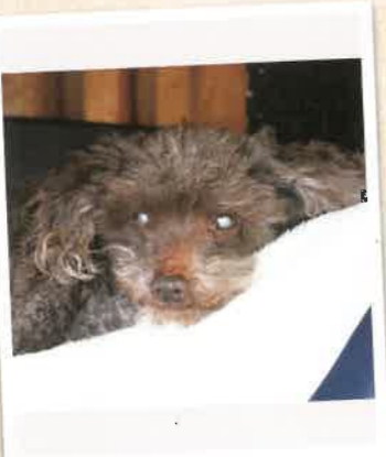
ティアラ 2022年 11/27 卒業