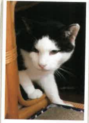
アニキ→梨依斗 2023年 1/9 卒業