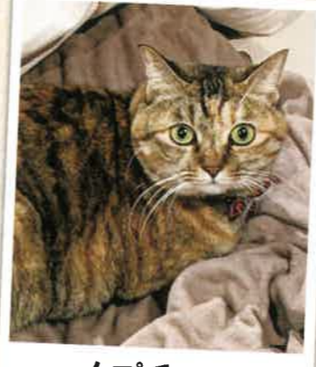
カプチーノ 2023年 1/17 卒業