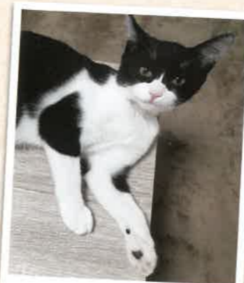
ヨル→うる 2022年 11/11 卒業