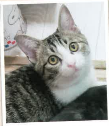
わんじ→雪獅子 2022年 11/20 卒業