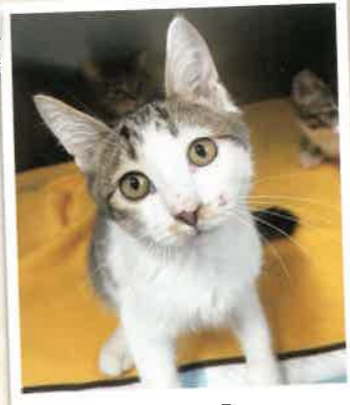
うりゅう 2022年 11/21 卒業