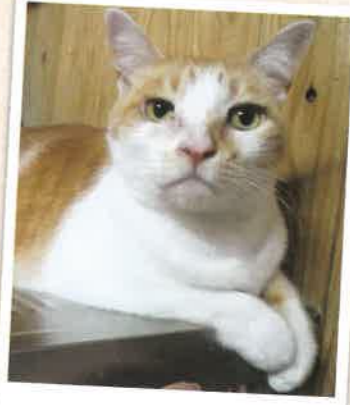
ノーマン 2022年 11/21 卒業