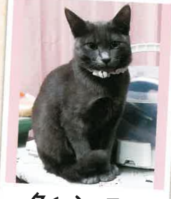
クイーン→ココ 2023年 1/23 卒業