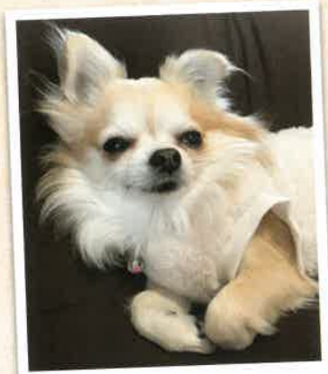
コロ助→ココ 2022年 12/13 卒業