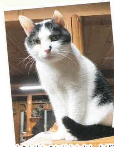
名前:サンデイ 年齢:10歳 男の子

大きな体なのに甘えたさん。よく棚の上から呼んでくれます!ご飯をあげに行くと、鳴きながら後ろをついてきてアピールしてくれます!