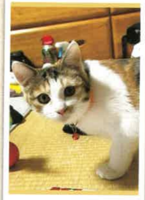
ゆず 2022年 12/4 卒業