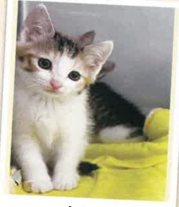
かりん 2022年 11/21 卒業