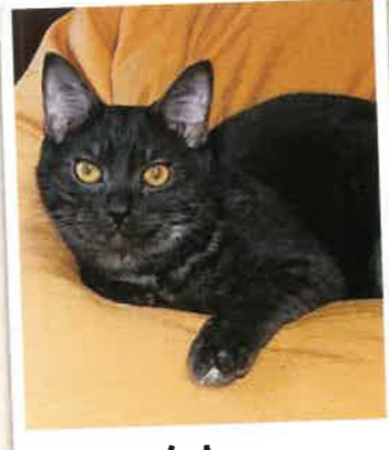
カルー 2023年 1/19 卒業