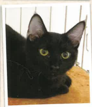
フィニアス 2022年 11/6 卒業