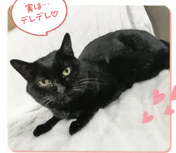
よるいちさん 推定13歳 女の子

棚の上やホットカーペットの上が定位置になりました。急に近くに行くと少し警戒しますが、においをかいでもらってからそっと撫でてあげると嬉しそうにしてくれます♡