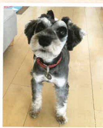
キャビー 2022年 12/6 卒業