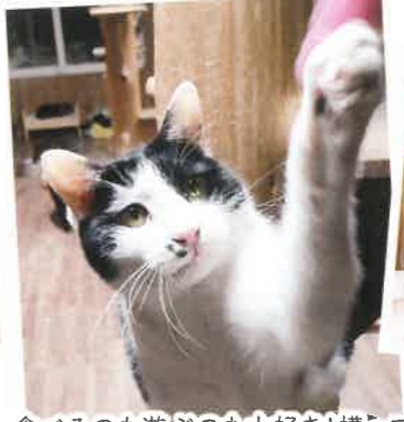
名前:あんちゃん 年齢:8歳 男の子

食べるのも遊ぶのも大好き!構ってもらえる時は甘えたさんになります。口元にある2つのほくろがチャームポイント。チュールもおもちゃも大好きです。