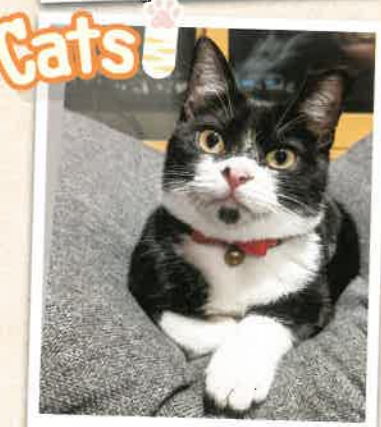
やちる→結(むすび) 2022年 11/1 卒業