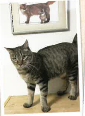
まこと 2022年 12/13 卒業