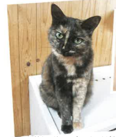
名前:みく (エイズキャリア) 年齢:3歳 女の子

大きな体のトトロ!猫ちゃんと仲良しです。当初は警戒心が強くシャーシャー言っていたんですが今は落ち着いて過ごしています!なでなでできるようになりました!