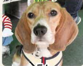
ラム 推定2歳 女の子