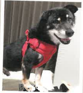
チョメ助 2022年 8/29 卒業