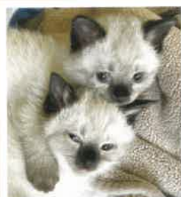
つぶあん&こしあん 2022年 8/28 卒業