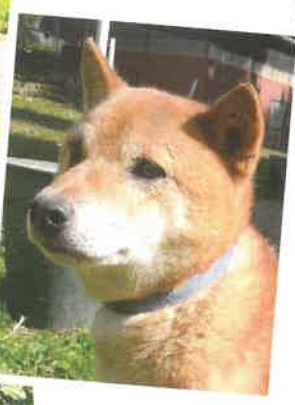
名前:とい 年齢:5歳 男の子

ぼっちゃりで少し怖がり。犬舎内では逃げ回って最終的には小屋の 中に避難します。おやつは大好き。手から食べてくれます。ドッグラン では元気に走り回ります。