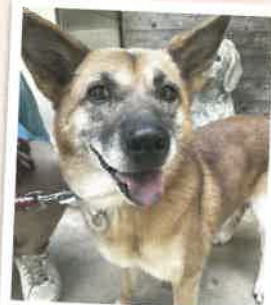
ムーミン 2022年 10/23 卒業