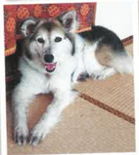
グリ 2022年 6/22 卒業