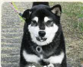
パッキー 推定10歳 男の子