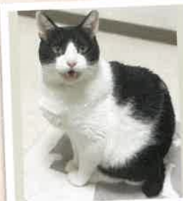
ゴン 2022年 6/2 卒業