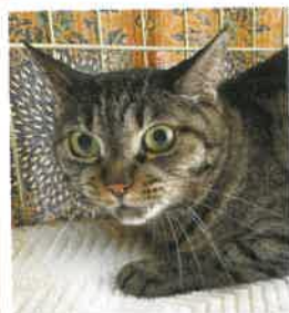
ラム 2022年 6/15 卒業