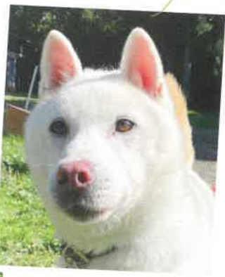
名前:小暮 年齢:7歳 男の子

ドッグランに出すと楽しそうにあちこち散歩します。人好きですが、 気分屋なところがあるので、ガウツと怒る事もしばしば…。デッキ ブラシが嫌いなようで掃除をしているとブラシに噛みついて邪魔を してきます。