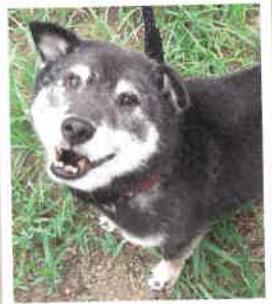
すぐる→こたろう 2022年 8/6 卒業