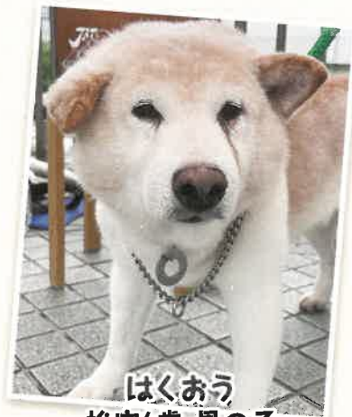
はくおう 推定6歳 男の子

強面のパッキーですが甘えたさんです。施設では受付ボーイとして皆さんを歓迎しています!!