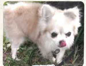
コロ助 推定10歳 男の子