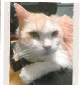
おさむ 2022年 6/4 卒業