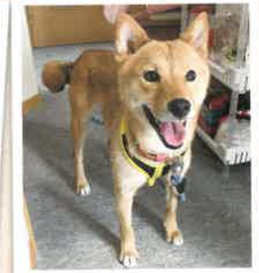
いよ→みや 2022年 8/27 卒業