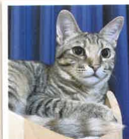
レオ→のの 2022年 9/10 卒業