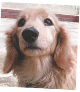
名前:ゆたか 年齢:10歳 男の子

人もご飯も大好きなおじいちゃん。ご飯の時間になると若い子に 負けない大きな声でアピールしてきます。足腰が弱いので一緒に のんびりとした生活を送って下さるご家族さん、大募集!