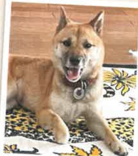
まむ 2022年 8/14 卒業