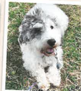
サイラ 2022年 10/25 卒業