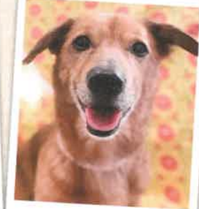
パブル→ペーター 2022年 10/2 卒業