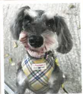
チョコ→レイ 2022年 10/16 卒業