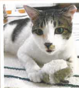
ドン 2022年 5/28 卒業