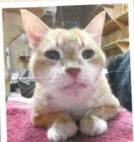
アキラ 2022年 8/22 卒業