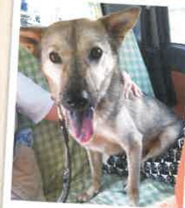
さつき→モン 2022年 8/24 卒業