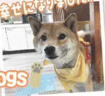
かなほ→むぎ 2022年 5/22 卒業