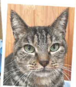
名前:エル 年齢:7歳 男の子

小柄なエルちゃん!甘えたいときはスリスリ~してくれます!マイペースでのんびり過ごしています。