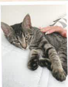
ねむ→キキ 2022年 10/18 卒業