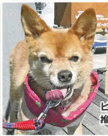
ビル 推定8歳 男の子

のんびりマイペースなはくおう。春にデビューしたもろにそっくりですが、間違えないでね♡