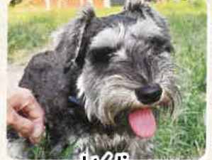
いくら 推定6ヶ月 女の子