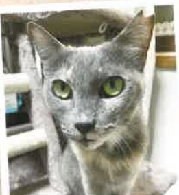
フェミ→あんな 2022年 9/23 卒業