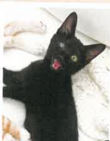
けんけん→凧太郎 2022年 10/22 卒業