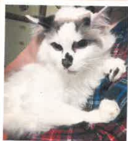
アレン 2022年 5/23 卒業