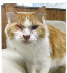
ルーカス 2022年 8/22 卒業