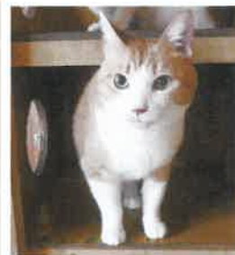
ナッツ→てまり 2022年 8/2 卒業