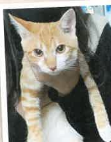
みっちー→蓮太郎 2022年 10/22 卒業