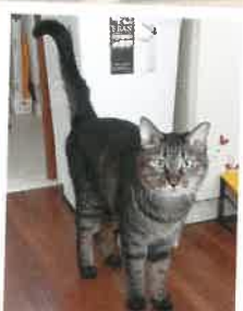
トッポ 2022年 10/19 卒業