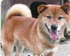
なつく 推定9歳 男の子