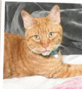
ふうま→マロン 2022年 6/5 卒業