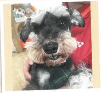
玉藻 2022年 5/28 卒業