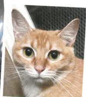
名前:きんくま 年齢:1歳 女の子

とっても美人さん!キャットマンションの中がお気に入りの場所です。ご飯の時間になると一生懸命アピールしてくれます!少しビビリですが、あごを撫でてあげるとゴロゴロ言ってくれます♡