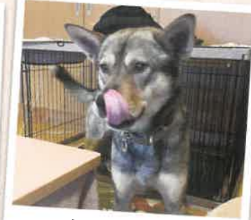
カコス・ワナ 2022年 6/9 卒業