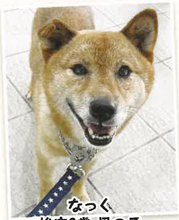
なっくん 推定9歳 男の子

にゅっと上がった口角がチャームポイントのなっくん!!ちょっと怖がりなので下から優しく撫でてもらえると嬉しいです!