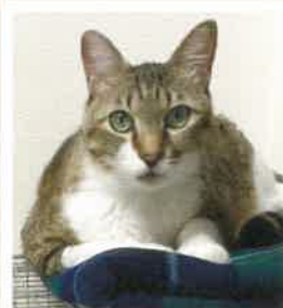
かばお→シナモン 2022年 9/2 卒業