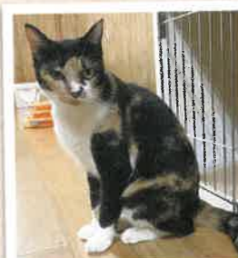
サイゼ→ミミ 2022年 10/18 卒業