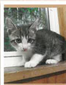
らんぎく→ラン 2022年 10/27 卒業

ご希望のご家族様には、動物をスムーズに迎えていただけるよう、面談を受けて頂いております。 悪しからずご了承くださいませ。まずは、お気軽に見学会にご参加下さい。