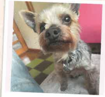
ロロ 2022年 6/4 卒業