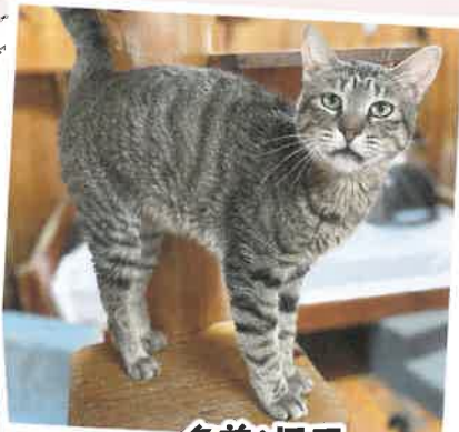
名前:ロコ 年齢:6歳 男の子

人も猫も苦手ではありませんが、1人でのんびりとしている方が好きな子です。ご飯の時間になると棚の上から鳴いてアピール!