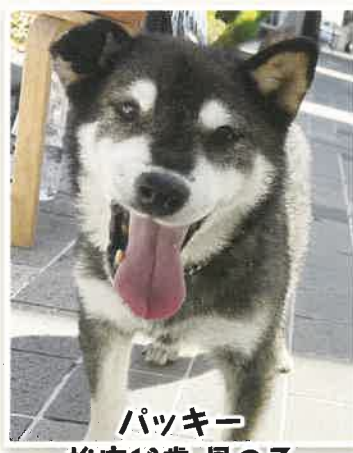
パッキー 推定10歳 男の子

にゅっと上がった口角がチャームポイントのなっくん!!ちょっと怖がりなので下から優しく撫でてもらえると嬉しいです!