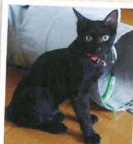
ぎん→雷伝 2022年 10/2 卒業