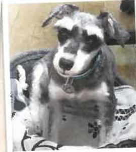
しゃけ→アンジュ 2022年 10/2 卒業