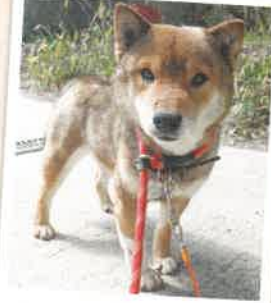
もものすけ→仗助 2022年 9/18 卒業