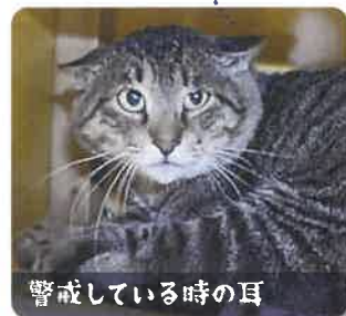
警戒している時の耳