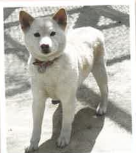
はくねん 2022年 10/7 卒業