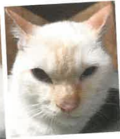
名前:みかん 年齢:1歳 男の子

とにかくご飯が大好きな食いしん坊!特徴的な声でご飯が欲しい!と伝えてくれます。撫でると喜んでスリスリしてくれる愛らしい男の子です。