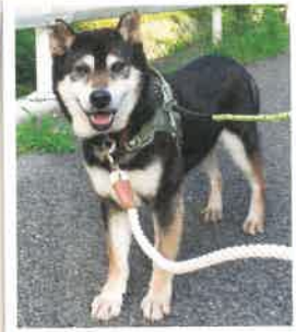
千曲 2022年 8/18 卒業