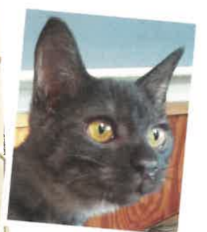
名前:カルー 年齢:4カ月 男の子

交通事故により母猫を失い一人ぼっちになってしまいました。まだ小さかったので甘えかたが不器用です。目が合うとシャーと威嚇することはありますが手は出さず、注意深く接してくれる思慮深く優しい子です。