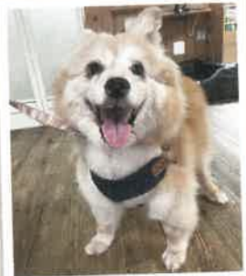
ジョージ 2022年 7/16 卒業