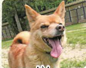
ビル 推定8歳 男の子