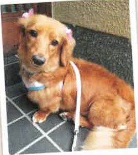
フー子→風子 2022年 9/15 卒業