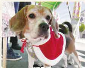
マトン 推定5歳 女の子