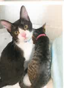
とうしろ→ジジ 2022年 10/18 卒業