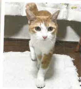
でこぼん 2022年 5/25 卒業