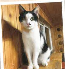
しんたろう→新太郎 2022年 9/18 卒業