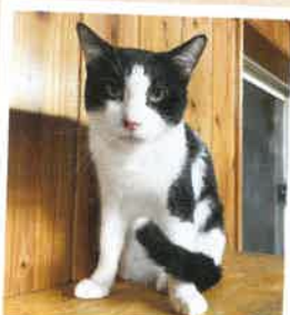
ベンツ→小太郎 2022年 9/18 卒業