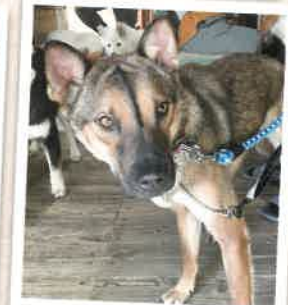
九花 2022年 10/29 卒業