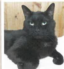
ピュア→くま 2022年 8/21 卒業