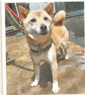
くみ→風 2022年 7/28 卒業