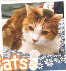
ハイジ 2022年 5/22 卒業