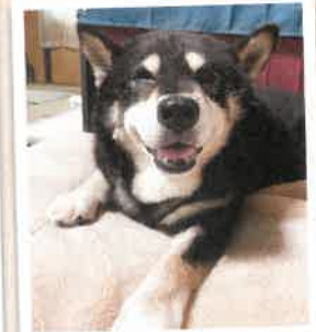
ブンちゃん→福太郎 2022年 7/31 卒業