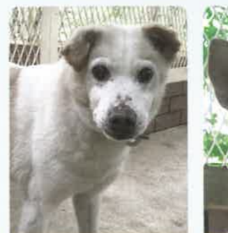
ビストロ 7才 ♂