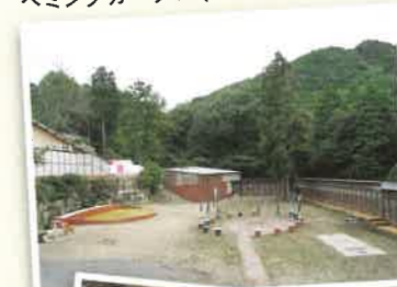
ヘミングガーデン(ドッグラン)