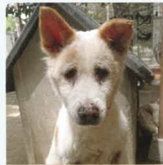
ビーモ 16才 ♀