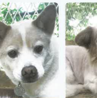
マエストロ 7才 ♂