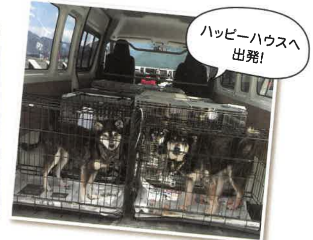
ハッピーハウスへ 出発!