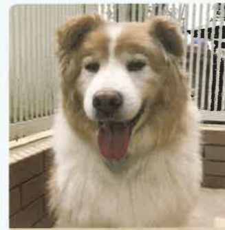
ミシュラン 13才 ♂