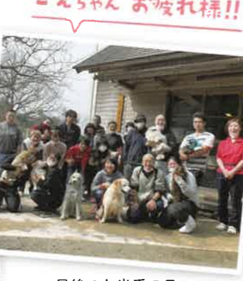
最後のお当番の日、出発前に記念撮影