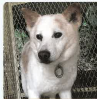
ジンジャー 10才 ♂