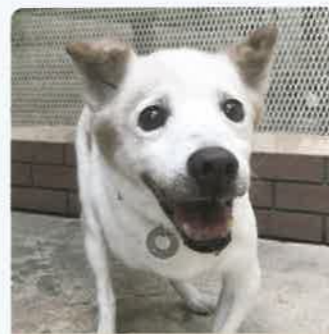
きりん 6才 ♀