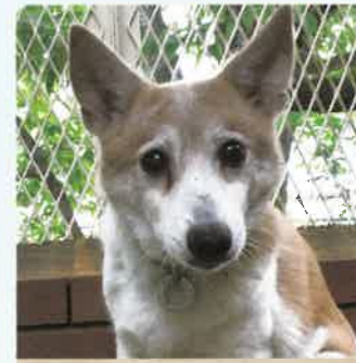
メグ 6才 ♀