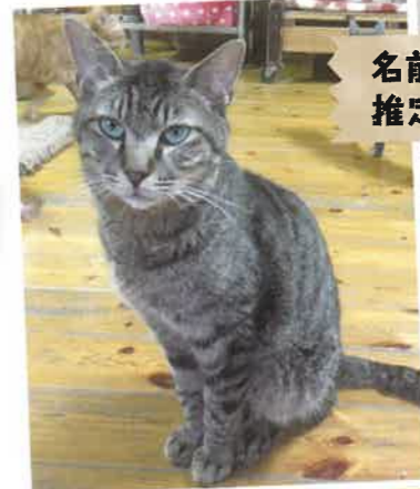
名前:コロネ 推定年齢:4才 男の子

保護当時は隠れてばかりでなかなか姿を見せ てくれませんが、今ではご飯の時間以外も姿を見 せてくれるようになりました。少しずつ人にも慣 れてきて、撫でさせてくれるようになりました。 撫でているうちにウトウトと してやることもあり、その姿がとっても可愛い子 です。