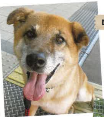
ロンゲ 推定4才 ♀

とっても活発な女の子。人が大好きで自分からくっついて甘えてくれる可愛い子です!右耳あたりの毛が長いのでロンゲという名前になりました!!