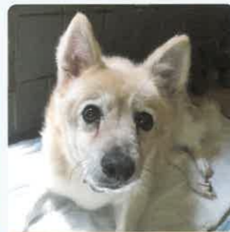
テンブル 12才 ♂