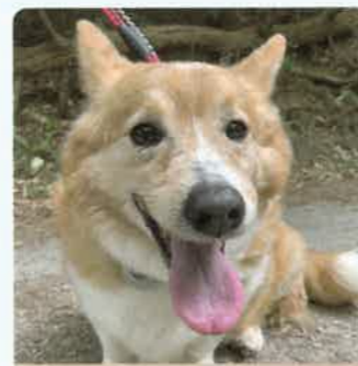
一休 10才 ♂