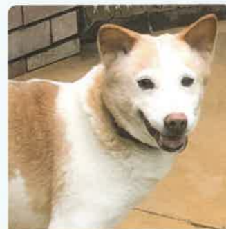
テラー 8才 ♀