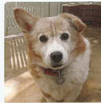
テイフ 12才 ♂