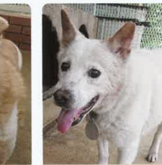
桃尻 11才 ♂