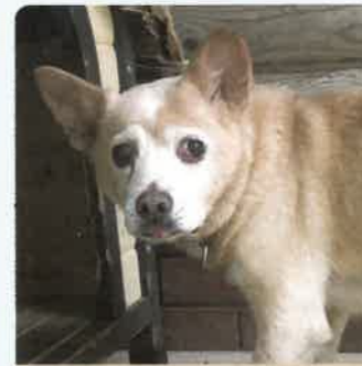
パンちゃん 7才 ♀