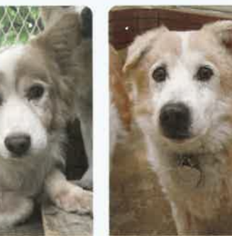
三ツ星 6才 ♂