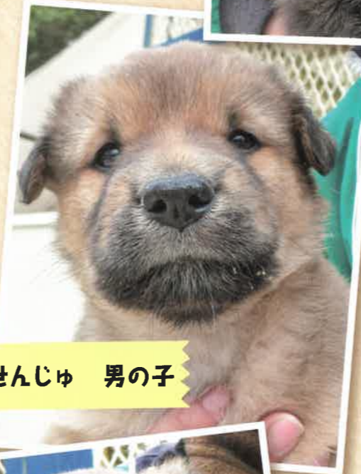
名前:せんじゅ 男の子