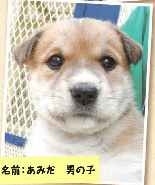
名前:あみだ 男の子