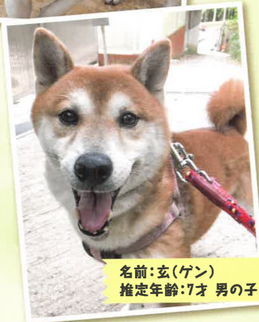
名前: 玄(ケン) 推定年齢: 7才 男の子