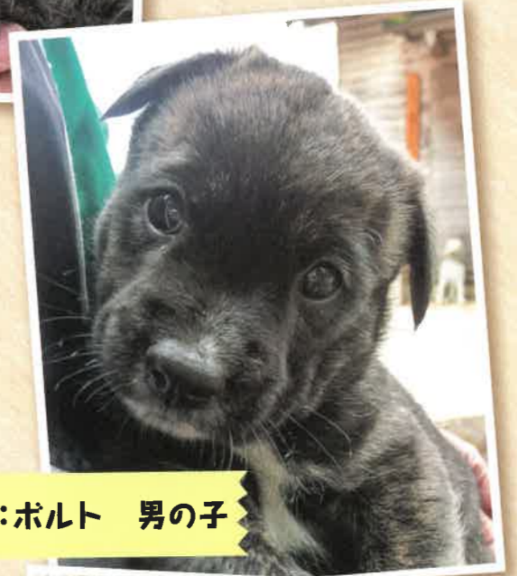
名前:ボルト 男の子