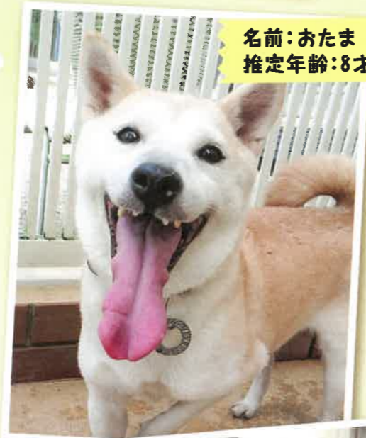
名前: おたま 推定年齢: 8才 女の子