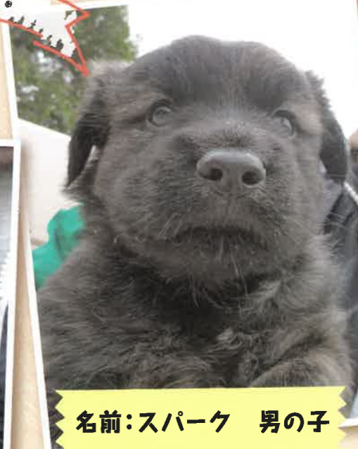
名前:スパーク 男の子