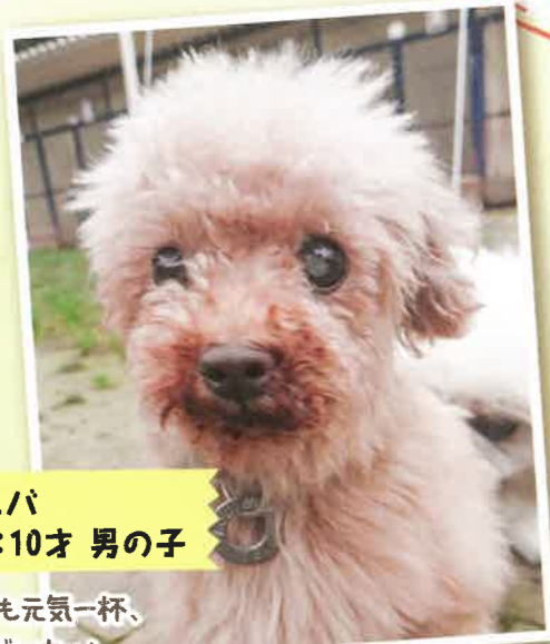
名前: ユニバ 推定年齢: 10才 男の子

ハッピー通信87号で紹介させていただいた 愛媛県からきた小型犬40頭。 去年の5月に施設に来て、現在残っている子は2匹!!! 皆様のご協力ありがとうございます。 2頭の施設に残っている子の紹介をさせていただきます。