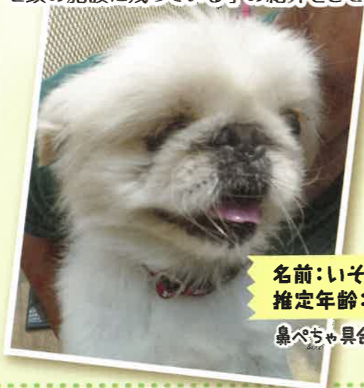
名前: いそべえ 推定年齢: 6才 男の子