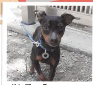
フレディ→Reoになりました 2017年 5/27 卒業