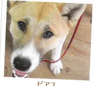
ピアス 2017年 8/5 卒業