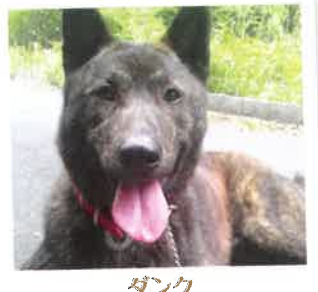
ダンク 2017年 8/9 卒業