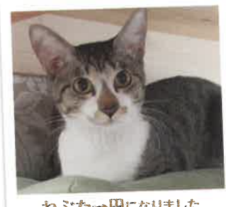
ねぶた→円になりました 2017年 5/12 卒業