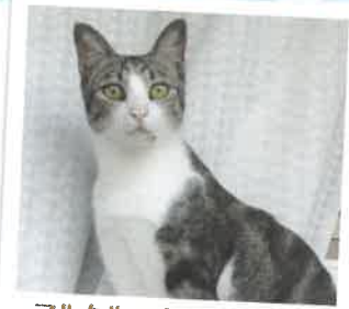
マルクル→ナツになりました 2017年 6/19 卒業