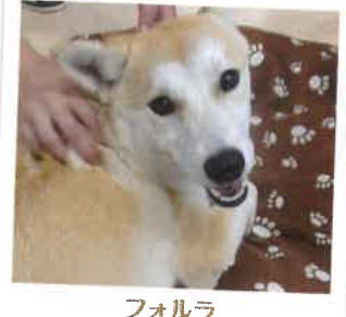
フォルラ 2017年 7/29 卒業