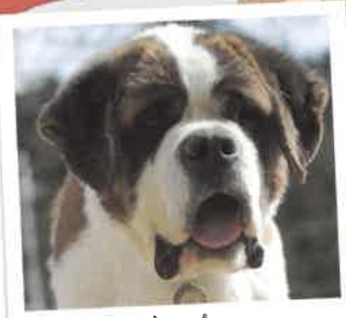
じゃん 2017年 5/29 卒業