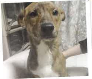
琴→フローラになりました* 2017年 2/9 卒業