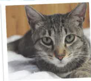
ギッチョ→ギーターになりました 2017年 6/10 卒業