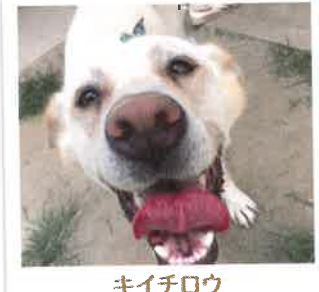
キイチロウ 2017年 7/19 卒業