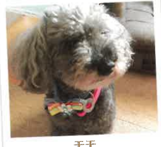
モモ 2017年 8/6 卒業