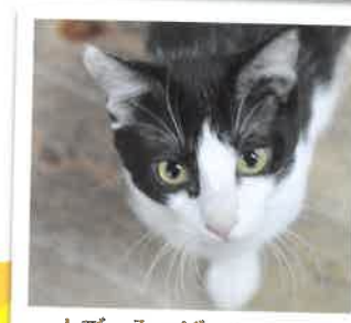
カブ→みつばになりました 2017年 7/1 卒業