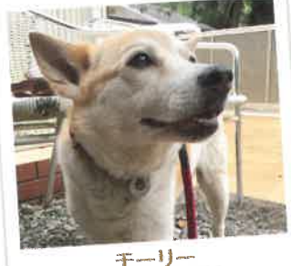
モーリー 2017年 7/22 卒業