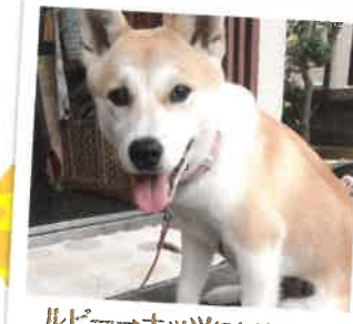
ルビー→ナツになりました 2017年 6/7 卒業