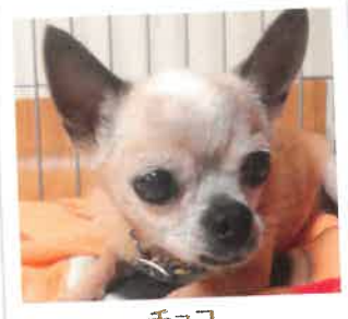
チョコ 2017年 6/18 卒業