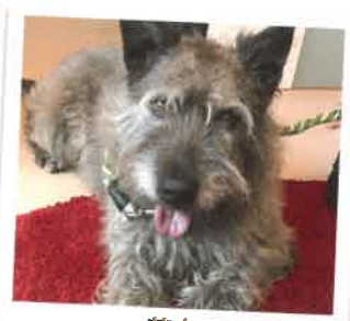
茶吉 2017年 5/31 卒業