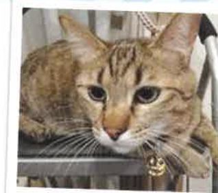
ゴン→ゴン太になりました 2017年 6/5 卒業