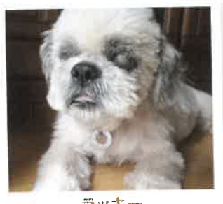
ラッキー 2017年 6/20 卒業