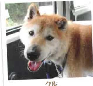
クル 2017年 6/24 卒業