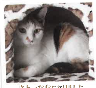
さと→ななになりました 2017年 5/27 卒業