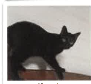
ジャック 2017年 7/1 卒業