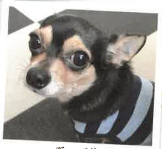
チャペル 2017年 6/6 卒業