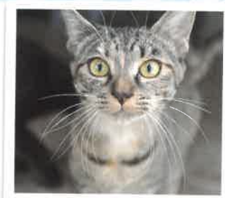
チーズ→むぎになりました 2017年 6/11 卒業