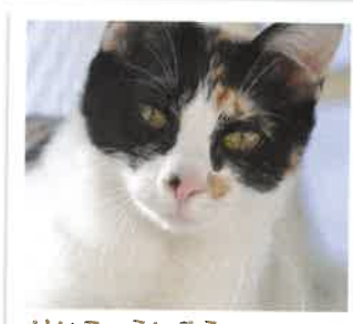
けいこ→ういろうになりました 2017年 7/3 卒業