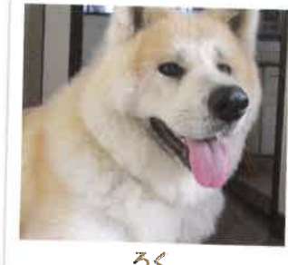
ろく 2017年 8/1 卒業