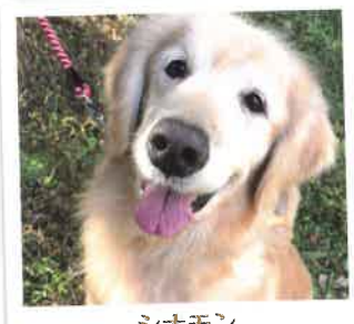
シナモン 2017年 6/14 卒業