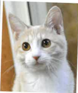
朝顔→もも になりました 2018年 2/17 卒業