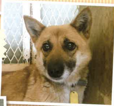
名前:ムーミン 推定年齢:5才 女の子