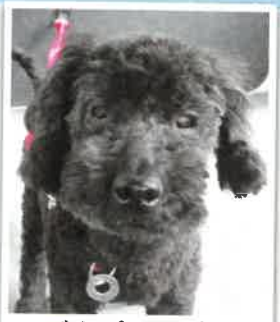
ごまプー→ゴマ になりました 2018年 4/30 卒業