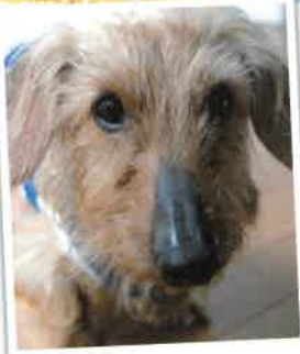
もんじゃ 2018年 3/24 卒業