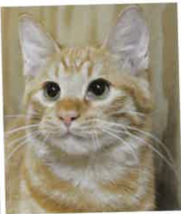
ともき 2018年 2/18 卒業