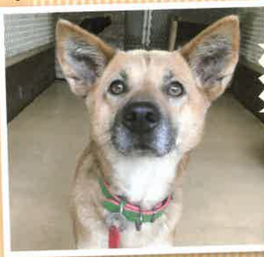
名前:チビ 推定年齢:12才 女の子