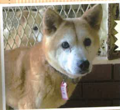
名前:ララ 推定年齢:7才 女の子