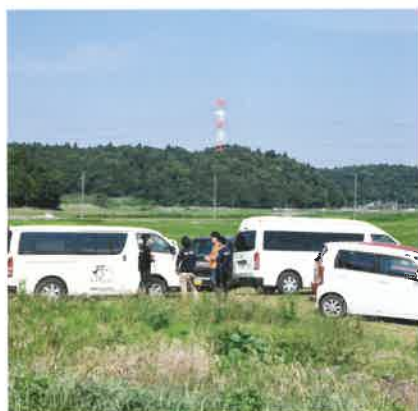
「さあ、ハッピーハウスへ帰ろう！」