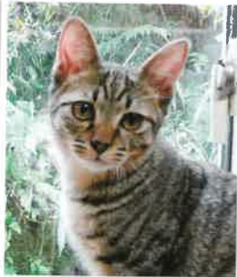
まさし→すず になりました 2018年 2/3 卒業