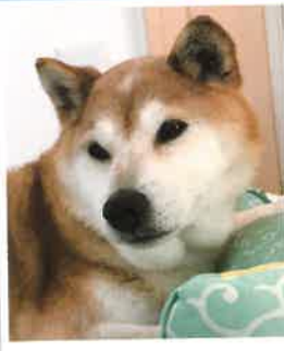
しじみ 2018年 4/19 卒業