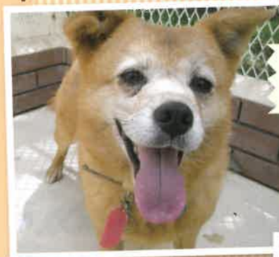
名前:うるるん 推定年齢:3才 女の子