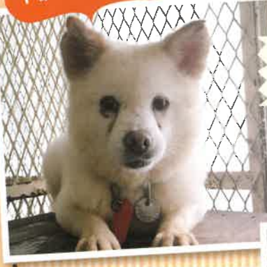
名前:ステファニー 推定年齢:4才 女の子