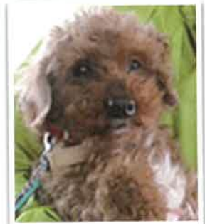
パナップ→もじゃ丸 になりました 2018年 3/11 卒業