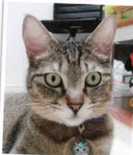
アリス 2018年 4/14 卒業