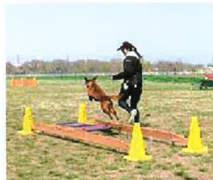
ロングジャンプ風景