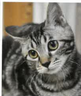
ミキ→さくら になりました 2018年 3/20 卒業