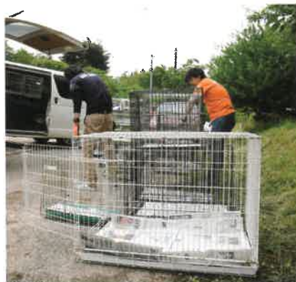
わんこたちを乗せ始めます。