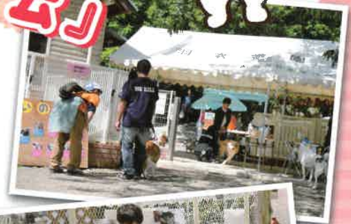
Photo by STUDIO FUNTAS https://studioduntas.jimdofree.com/ ボランティアで撮影協力下さいました。

1頭でもお気にかかった子はありましたでしょうか?どうか幸福な家族の一員にしてあげて下さい。首を長くして、皆で待っています。