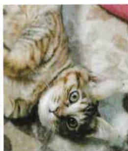
かずは 2018年 4/22 卒業