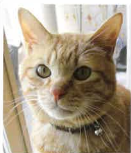
だいず→ぽんず になりました 2018年 4/21 卒業