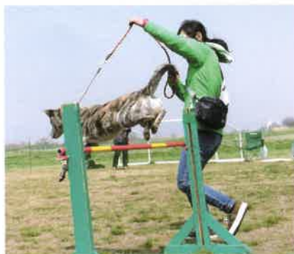
ハイジャンプ風景

競技内容はカミング(おいで)、ジャンプ(ロングジャンプとハイジャンプ2種類あり、それぞれ跳ぶ高さや長さを競います。)、ウェイト(マテ)の3種目あります。ジャンプ以外は予選があり、一次予選でいい結果を残さないと二次予選には残れません。