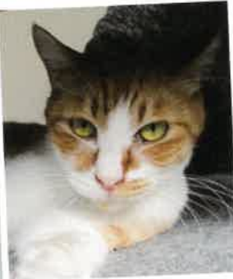
トラオ 2018年 2/24 卒業