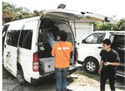
作業は進んでいきます。