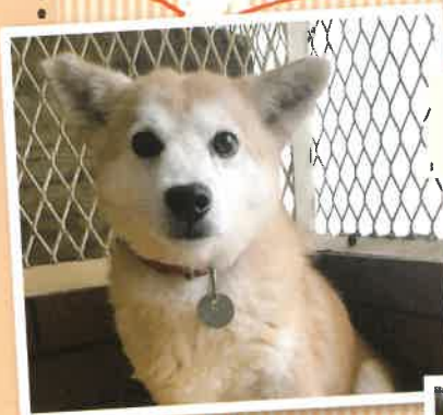
名前:イオン 推定年齢:2才 女の子