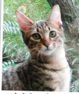
まさと→あられ になりました 2018年 2/3 卒業