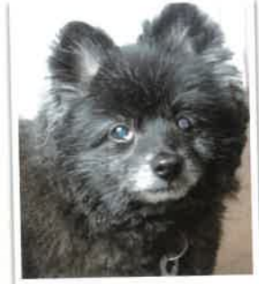
ふき 2018年 3/24 卒業