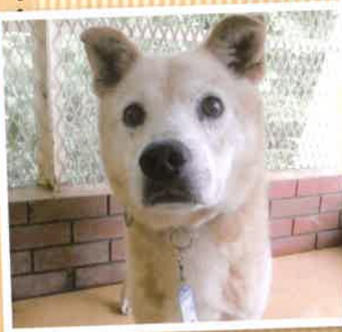
名前:パル 推定年齢:3才 女の子