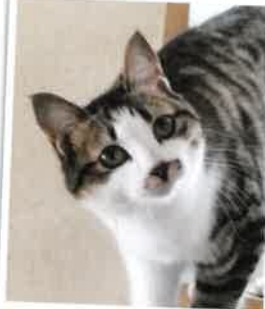
れんげ 2018年 2/4 卒業