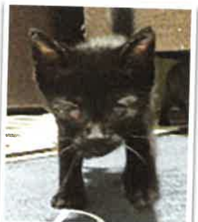
ラスク 2018年 3/11 卒業