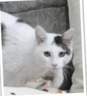
みきと→アル になりました 2018年 4/14 卒業