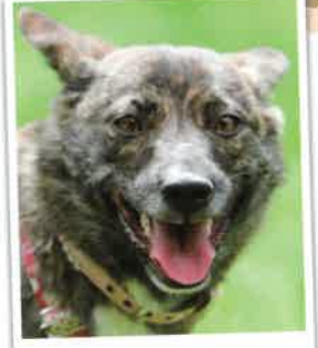
タイ 2018年 2/10 卒業