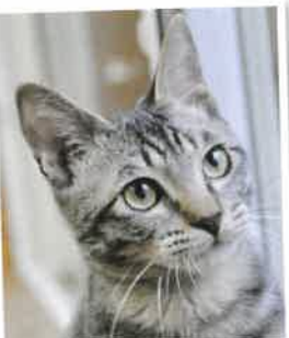
ハジメ 2018年 4/17 卒業