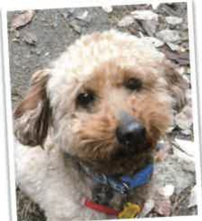
ポリス→松太郎 になりました 2018年 3/1 卒業