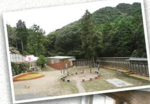
ヘミングガーデン (ドッグラン)