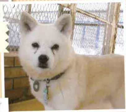
名前:トニー 推定年齢:8才 男の子