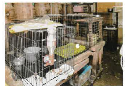
環境は適切とは言えませんでした