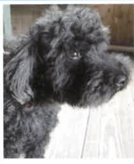
ミル 2018年 4/7 卒業