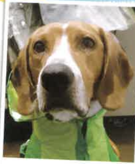
バックス 2018年 4/21 卒業