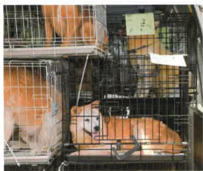
もうすぐ車の中はいっぱいに