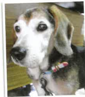
B子→こまめ になりました 2018年 3/14 卒業