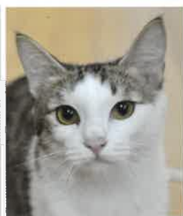
かすみ 2018年 3/6 卒業