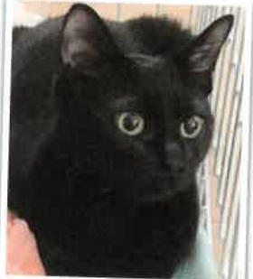
ザクローラム になりました 2018年 2/12 卒業