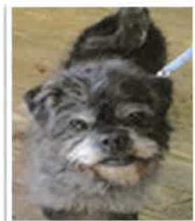
まちこ 2018年 2/23 卒業